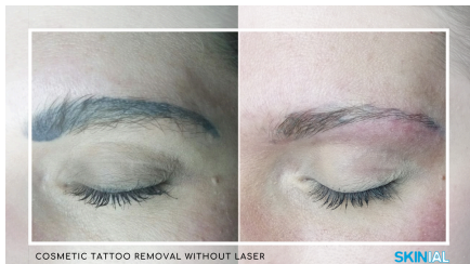
Reale Ergebnisse mit der SKINIAL-Methode